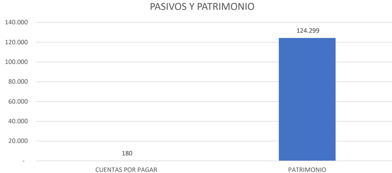
Gráfico representativo en millones de pesos