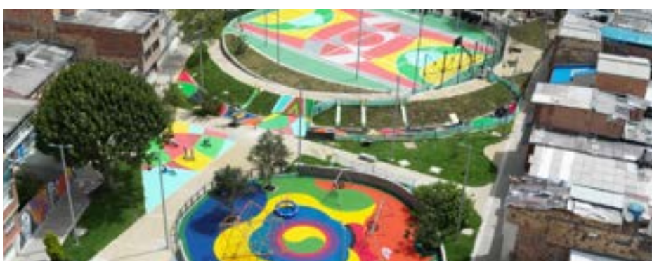
Divino Niño - Laguneta