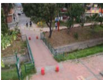
Dg. 52 A Sur con Kr. 61 Bis