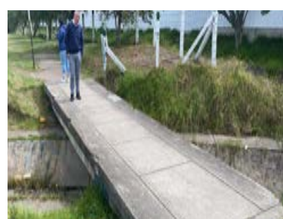
Tv. 44 Sur con Kr. 61 Bis